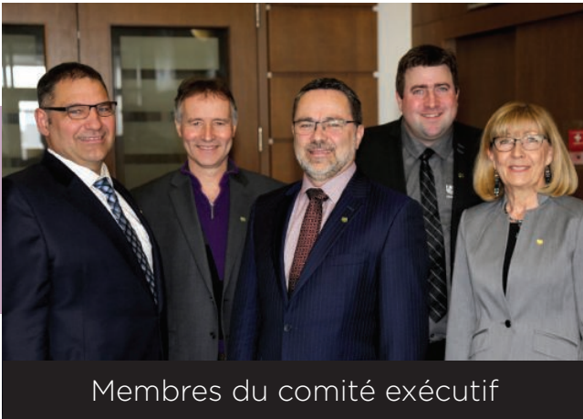
Membres du comité exécutif

Vendredi dernier, les administrateurs ont voté à l'unanimité pour que le dossier de la fiscalité foncière soit la principale priorité de la Fédération de l'UPA de la Montérégie dans le cadre des élections provinciales.